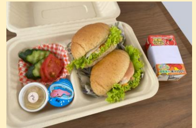
▲小学生ランチセット

お子さま用ランチセットは小学生以下の方のみご注文いただけます。 商品のお受け取りの際、必ずお子さまも一緒にご来店ください。